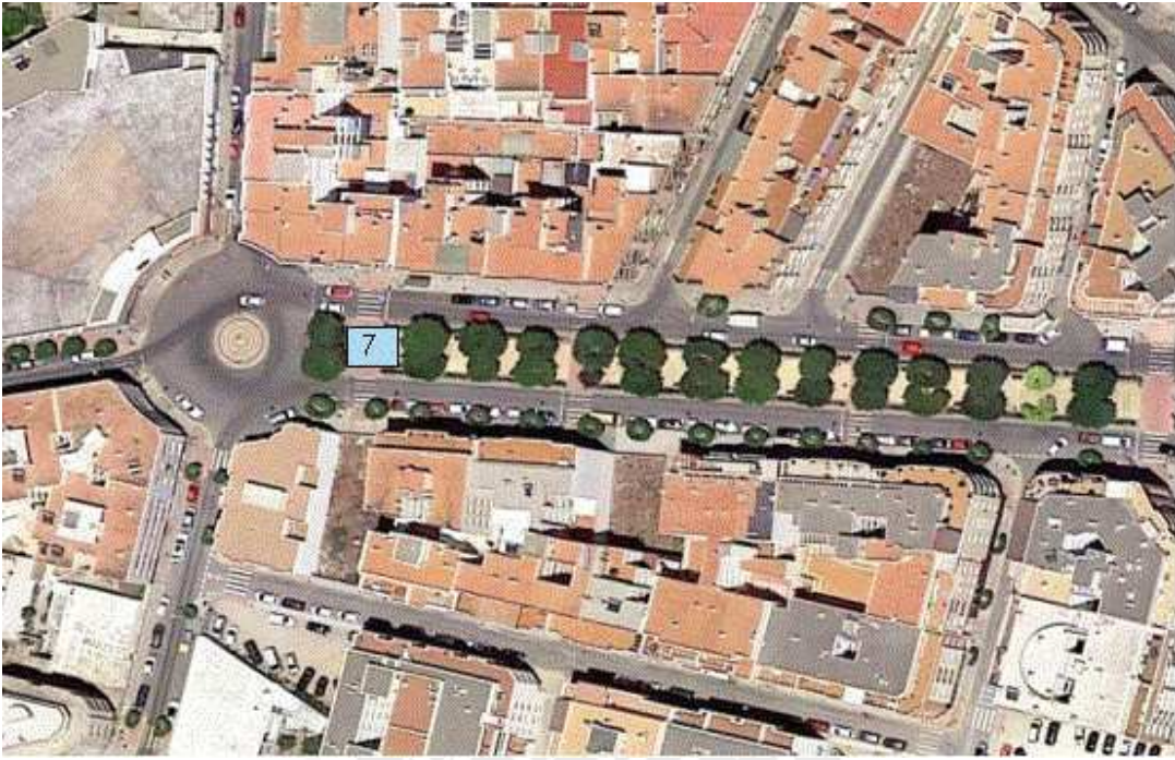
Parque Municipal y C/ Arquitecto Pérez de Arenaza